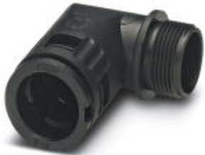
Cable gland, metric thread, IP66 protection, angled

Please be informed that the data shown in this PDF Document is generated from our Online Catalog. Please find the complete data in the user's documentation. Our General Terms of Use for Downloads are valid ( http://phoenixcontact.com/download )