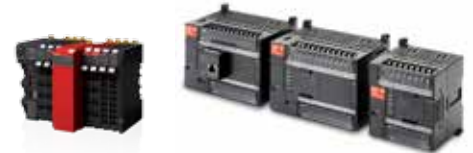
NX-S Sysmac Safety System