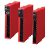
G9SE Series Safety Relay Unit

Every switch needs to be monitored. Visit www.omron247.com to learn more about our complete line-up of safety monitoring relay units and programmable safety controllers.