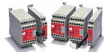
G9SA Series Safety Monitoring Relays