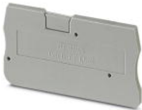
End cover, Length: 45 mm, Width: 2.2 mm, Height: 24.3 mm, Color: gray

Please be informed that the data shown in this PDF Document is generated from our Online Catalog. Please find the complete data in the user's documentation. Our General Terms of Use for Downloads are valid ( http://download.phoenixcontact.com )