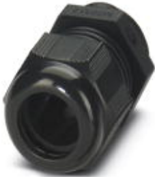
Cable gland, Cable gland material: Polyamide 6, External cable diameter 11 mm ... 17 mm, Shielding: No, Connecting thread: M25, Color: jet black

Please be informed that the data shown in this PDF Document is generated from our Online Catalog. Please find the complete data in the user's documentation. Our General Terms of Use for Downloads are valid ( http://phoenixcontact.com/download )