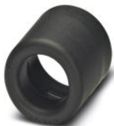
End sleeves as cable protection

Please be informed that the data shown in this PDF Document is generated from our Online Catalog. Please find the complete data in the user's documentation. Our General Terms of Use for Downloads are valid ( http://phoenixcontact.com/download )