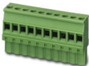
The figure shows a 10-position version of the product

Please be informed that the data shown in this PDF Document is generated from our Online Catalog. Please find the complete data in the user's documentation. Our General Terms of Use for Downloads are valid ( http://phoenixcontact.com/download )