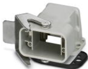
Panel mounting base with single locking engagement nose, angled design

Please be informed that the data shown in this PDF Document is generated from our Online Catalog. Please find the complete data in the user's documentation. Our General Terms of Use for Downloads are valid ( http://download.phoenixcontact.com )