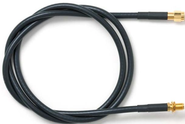
Model 73070-C SMA Plug to SMA Bulkhead Jack, RG58C/U

SMA Plug to SMA Bulkhead Jack, RG316/U, RG58C/U