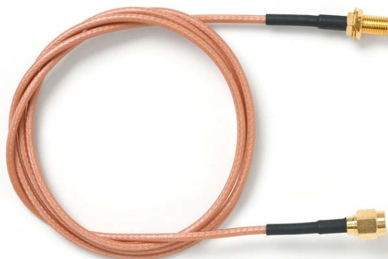
Model 73070-BB SMA Plug to SMA Bulkhead Jack, RG316/U