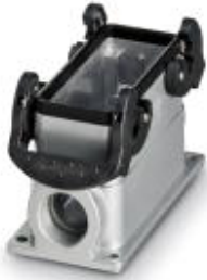
HEAVYCON box mounting base B16, with double locking latch, height 67 mm, with support 1xM32

Please be informed that the data shown in this PDF Document is generated from our Online Catalog. Please find the complete data in the user's documentation. Our General Terms of Use for Downloads are valid ( http://phoenixcontact.com/download )