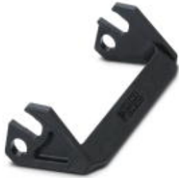
Replacement single locking latch for HEAVYCON EVO housing type B24, PA

Please be informed that the data shown in this PDF Document is generated from our Online Catalog. Please find the complete data in the user's documentation. Our General Terms of Use for Downloads are valid ( http://phoenixcontact.com/download )