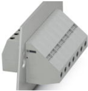
The illustration shows version HDFKV 25

Please be informed that the data shown in this PDF Document is generated from our Online Catalog. Please find the complete data in the user's documentation. Our General Terms of Use for Downloads are valid ( http://download.phoenixcontact.com )