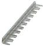
Fixed bridge, Number of positions: 10, Color: silver

Please be informed that the data shown in this PDF Document is generated from our Online Catalog. Please find the complete data in the user's documentation. Our General Terms of Use for Downloads are valid ( http://phoenixcontact.com/download )