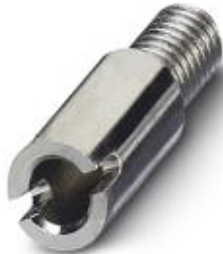
Female test connector, Color: silver

Please be informed that the data shown in this PDF Document is generated from our Online Catalog. Please find the complete data in the user's documentation. Our General Terms of Use for Downloads are valid ( http://download.phoenixcontact.com )