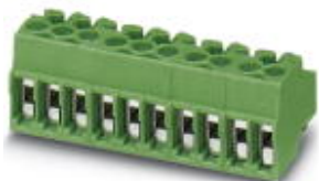
The figure shows the 10-position version

PCB connector, nominal current: 8 A, number of positions: 10, pitch: 3.5 mm, connection method: Screw connection with wire protector, color: red, contact surface: Tin