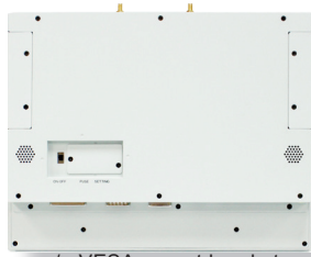
w/o VESA-mount bracket

Fanless 12.1" Industrial Panel PC with Intel® Atom™ N2600 1.6GHz