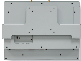
w/ VESA-mount bracket