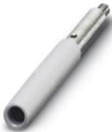
Female test connector, Color: gray

Please be informed that the data shown in this PDF Document is generated from our Online Catalog. Please find the complete data in the user's documentation. Our General Terms of Use for Downloads are valid ( http://download.phoenixcontact.com )