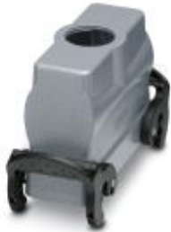
HEAVYCON B24 sleeve housing, with double locking latch, height: 72 mm, with 1 x M32 thread, straight cable outlet

Please be informed that the data shown in this PDF Document is generated from our Online Catalog. Please find the complete data in the user's documentation. Our General Terms of Use for Downloads are valid ( http://phoenixcontact.com/download )