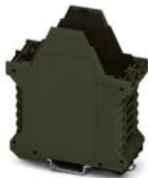
Component housing, length: 99 mm, Lower part, width: 45 mm, height: 114.5 mm

Please be informed that the data shown in this PDF Document is generated from our Online Catalog. Please find the complete data in the user's documentation. Our General Terms of Use for Downloads are valid ( http://phoenixcontact.com/download )