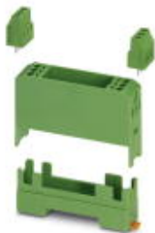
Electronic housing set, consisting of electronic housing and printed circuit termination blocks, pitch 5

Please be informed that the data shown in this PDF Document is generated from our Online Catalog. Please find the complete data in the user's documentation. Our General Terms of Use for Downloads are valid ( http://phoenixcontact.com/download )