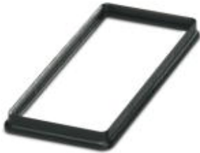
Profile gasket for sleeve housing type B16.....EEE

Please be informed that the data shown in this PDF Document is generated from our Online Catalog. Please find the complete data in the user's documentation. Our General Terms of Use for Downloads are valid ( http://phoenixcontact.com/download )