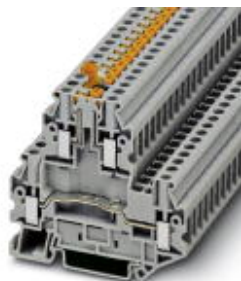
Knife disconnect terminal block, for mounting on NS 35..., color: blue, with test socket screws

Please be informed that the data shown in this PDF Document is generated from our Online Catalog. Please find the complete data in the user's documentation. Our General Terms of Use for Downloads are valid ( http://phoenixcontact.com/download )