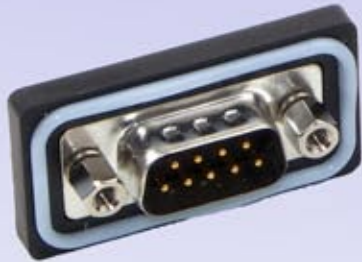
Panel Mount (DCPDB09MSC1)