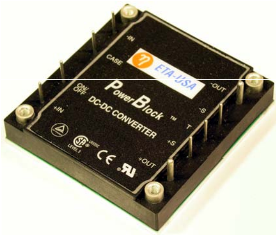
Size: 60.70mm x 57.91mm x 13.30mm (2.39in. x 2.28in. x 0.52in.)