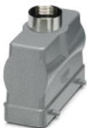
HEAVYCON sleeve housing B24, for double locking latch, height 76 mm, with support 1x M32, straight conductor exit

Please be informed that the data shown in this PDF Document is generated from our Online Catalog. Please find the complete data in the user's documentation. Our General Terms of Use for Downloads are valid ( http://phoenixcontact.com/download )