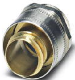
Cable gland made from brass with metric thread, rotatable, IP40 protection

Please be informed that the data shown in this PDF Document is generated from our Online Catalog. Please find the complete data in the user's documentation. Our General Terms of Use for Downloads are valid ( http://phoenixcontact.com/download )