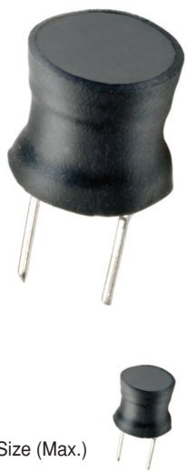
Actual Size (Max.)