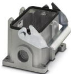
Box mounting base, with single locking latch, height: 100 mm, without screw connection, 2 x Pg36

Please be informed that the data shown in this PDF Document is generated from our Online Catalog. Please find the complete data in the user's documentation. Our General Terms of Use for Downloads are valid ( http://phoenixcontact.com/download )