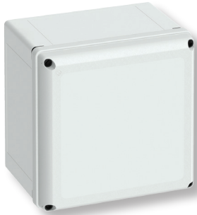
Cat No. 700-733 GEOS-L 3030-22-o with grey cover