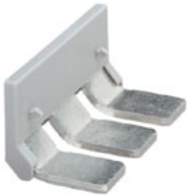
Insertion bridge, Number of positions: 3, Color: gray

Please be informed that the data shown in this PDF Document is generated from our Online Catalog. Please find the complete data in the user's documentation. Our General Terms of Use for Downloads are valid ( http://phoenixcontact.com/download )