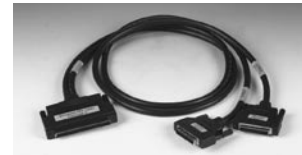
PCL-10251-1 100-Pin to Two 50-Pin SCSI Cable for PCI-1240, 1 m