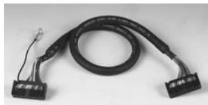
PCL-10121-1 20-Pin Shielded Cable, 1 m