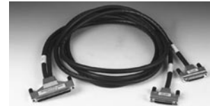
PCL-10250-2 100-Pin SCSI to Two 50-Pin SCSI Cable, 2 m