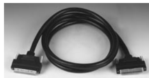
PCL-10168-2 68-Pin SCSI Cable, 2 m