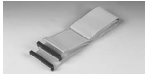
PCL-10150-1.2 50-Pin Flat Cable, 1.2 m