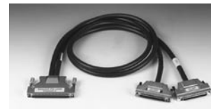
PCL-10268 100-Pin to Two 68-Pin SCSI Cable, 1 m