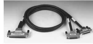
PCL-10250 100-Pin SCSI to Two 50-Pin SCSI Cable, 1 m