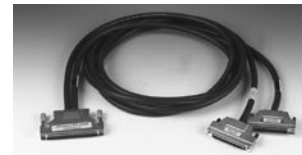
PCL-10268-2 100-Pin to Two 68-Pin SCSI Cable, 2 m