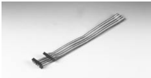
PCL-10120-1 20-Pin Flat Cable, 1 m