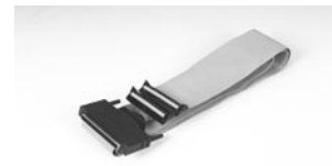
PCL-12250-1 100-Pin to Two 50-Pin Flat Cable for PCM-3240, 1 m