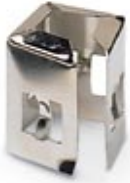
NEOZED special spring, for using fuse inserts D 01, in threaded caps D 02, for 2 A ... 16 A

Please be informed that the data shown in this PDF Document is generated from our Online Catalog. Please find the complete data in the user's documentation. Our General Terms of Use for Downloads are valid ( http://download.phoenixcontact.com )