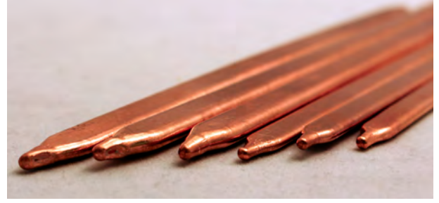
For Illustration Purposes ONLY.

Description: Closed evaporator-condenser heat transfer systems. A heat pipe's wick structure and embedded liquid enables it to produce a very high heat flux transport capability, which can be 10-20 times higher than the equivalent diameter solid copper pipe. Flat heat pipes are easier to attach to heat dissipating components.