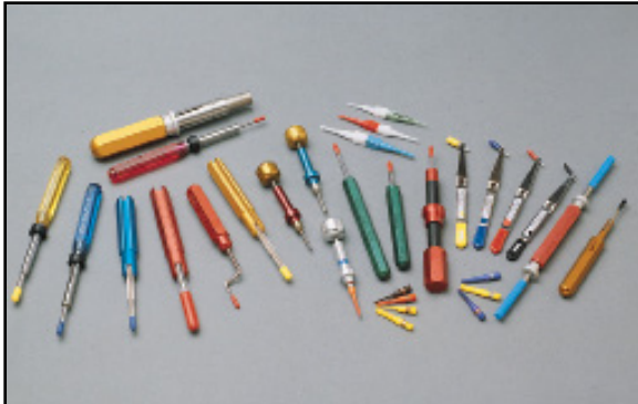
DMC1155 INSERTION AND REMOVAL TOOL KIT

DMC's General Purpose Insertion and Removal Tool Kit contains metal insertion and removal tools for Mil-Spec Circular Connectors, D-Subminiature Connector, Arinc Connectors and Mil-T-81714 terminal junctions.