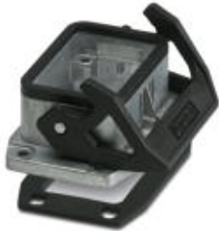
HEAVYCON B6 panel mounting base, with single locking latch, with flat gasket, salt-water-resistant aluminum, conductive profile gasket

Please be informed that the data shown in this PDF Document is generated from our Online Catalog. Please find the complete data in the user's documentation. Our General Terms of Use for Downloads are valid ( http://phoenixcontact.com/download )