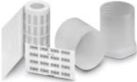
The figure shows the EML (15X9)R SR product variant

Label, Roll, silver/matt, unlabeled, can be labeled with: THERMOMARK ROLL, THERMOMARK ROLL X1, THERMOMARK X, THERMOMARK S1.1, Mounting type: Adhesive, Lettering field: 100 x 90 mm