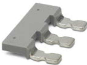
Insertion bridge, 3-pos., fully insulated

Please be informed that the data shown in this PDF Document is generated from our Online Catalog. Please find the complete data in the user's documentation. Our General Terms of Use for Downloads are valid ( http://phoenixcontact.com/download )