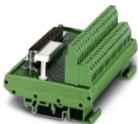
VARIOFACE module, with screw connection and D-Subminiature pin strip, for mounting on NS 35/7.5 or NS 32, 37-pos.

Please be informed that the data shown in this PDF Document is generated from our Online Catalog. Please find the complete data in the user's documentation. Our General Terms of Use for Downloads are valid ( http://phoenixcontact.com/download )