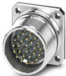
Device connector, rear mounting, straight, Screw locking, M27, number of positions: 26, type of contact: Pin, Solder connection, Flat gasket, 4xM3

Please be informed that the data shown in this PDF Document is generated from our Online Catalog. Please find the complete data in the user's documentation. Our General Terms of Use for Downloads are valid ( http://phoenixcontact.com/download )