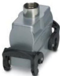
HEAVYCON B16 sleeve housing, with double locking latch, height: 56 mm, with 1 x M25 gland, straight cable outlet

Please be informed that the data shown in this PDF Document is generated from our Online Catalog. Please find the complete data in the user's documentation. Our General Terms of Use for Downloads are valid ( http://phoenixcontact.com/download )