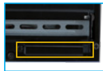
1 x Expansion slot (PCI/PCle) 1 x CF slot