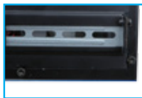
1 x Expansion slot (PCI/PCle) 1 x Internal 2.5" HDD