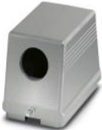
HEAVYCON sleeve housing B48, for single locking latch, height 96 mm, with thread 1x M32, lateral conductor exit

Please be informed that the data shown in this PDF Document is generated from our Online Catalog. Please find the complete data in the user's documentation. Our General Terms of Use for Downloads are valid ( http://download.phoenixcontact.com )