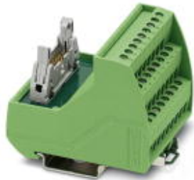
VARIOFACE sensor module, for connecting 8 pnp sensors, with LED

Please be informed that the data shown in this PDF Document is generated from our Online Catalog. Please find the complete data in the user's documentation. Our General Terms of Use for Downloads are valid ( http://phoenixcontact.com/download )