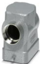
HEAVYCON sleeve housing B6, for single locking latch, height 72 mm, with support 1x M32, lateral conductor exit

Please be informed that the data shown in this PDF Document is generated from our Online Catalog. Please find the complete data in the user's documentation. Our General Terms of Use for Downloads are valid ( http://phoenixcontact.com/download )