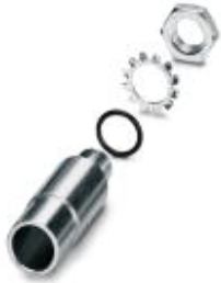
Adapter for single-hole mounting

Please be informed that the data shown in this PDF Document is generated from our Online Catalog. Please find the complete data in the user's documentation. Our General Terms of Use for Downloads are valid ( http://phoenixcontact.com/download )