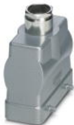
HEAVYCON B16 sleeve housing, for double locking latch, height: 76 mm, with 1 x Pg21 screw connection, straight cable outlet

Please be informed that the data shown in this PDF Document is generated from our Online Catalog. Please find the complete data in the user's documentation. Our General Terms of Use for Downloads are valid ( http://phoenixcontact.com/download )