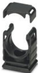
Hose holder with cover

Please be informed that the data shown in this PDF Document is generated from our Online Catalog. Please find the complete data in the user's documentation. Our General Terms of Use for Downloads are valid ( http://phoenixcontact.com/download )