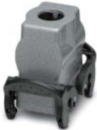
HEAVYCON sleeve housing B10, with double locking latch, height 72 mm, with thread 1x M25, straight conductor exit

Please be informed that the data shown in this PDF Document is generated from our Online Catalog. Please find the complete data in the user's documentation. Our General Terms of Use for Downloads are valid ( http://phoenixcontact.com/download )