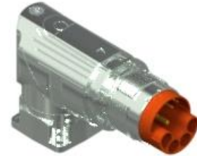
Contact Arrangement mating view