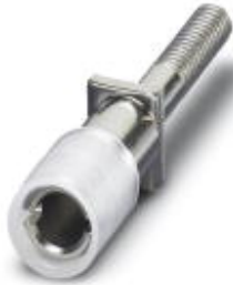
Female test connector, Color: silver

Please be informed that the data shown in this PDF Document is generated from our Online Catalog. Please find the complete data in the user's documentation. Our General Terms of Use for Downloads are valid ( http://download.phoenixcontact.com )