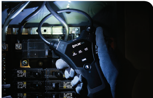
FLIR TA72 with work lights