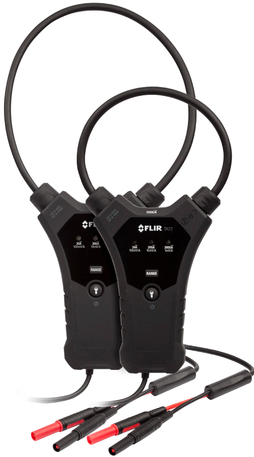
TA74 & TA72