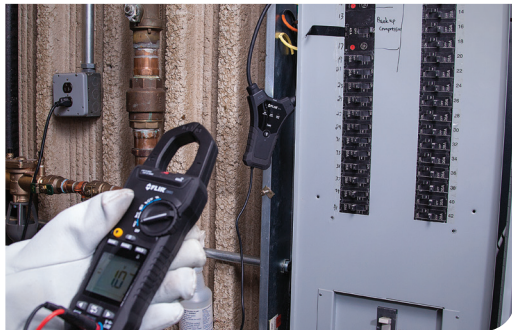
FLIR TA74 used in concert with the FLIR CM83 Clamp Meter